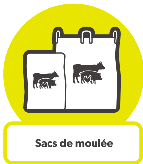
Sacs de moulée